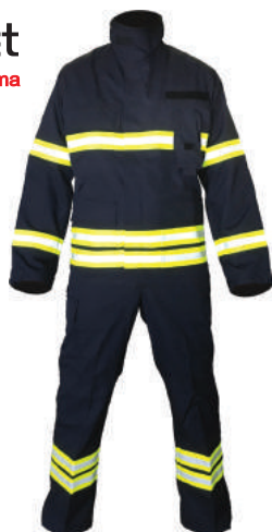
Odijela za požare otvorenog prostora