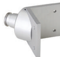
Power Shore blokirajuća glava