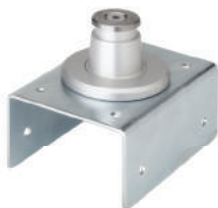
Glava za potporu 100 mm