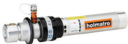
Power Shore Podupora HS 1 Q 5 FL