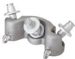
Okretna trosmjerna glava