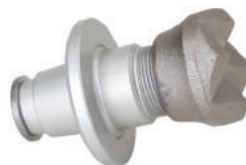
Power Shore križna glava