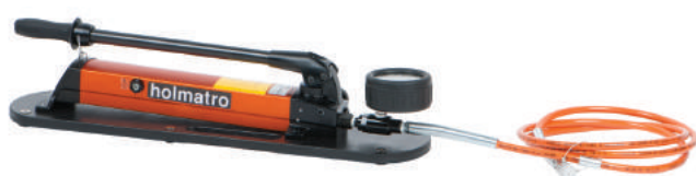
Ručna pumpa za Power Shore podupore