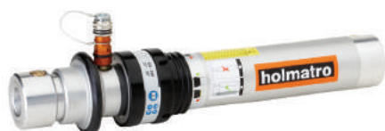
Power Shore Podupora HS 1 Q 5 FL